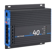
SC 40 bei 24-V-Batterien