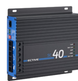
SC 40 bei 24-V-Batterien